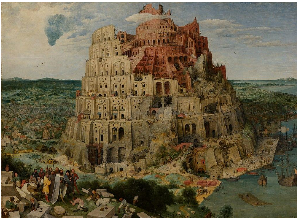
Pieter Bruegel starší – Babylonská věž